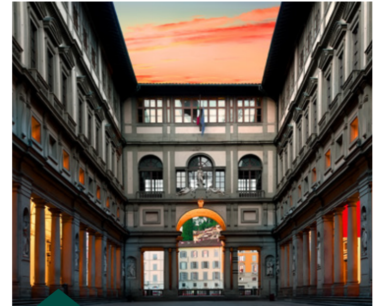
Gallerie degli Uffizi - Firenze