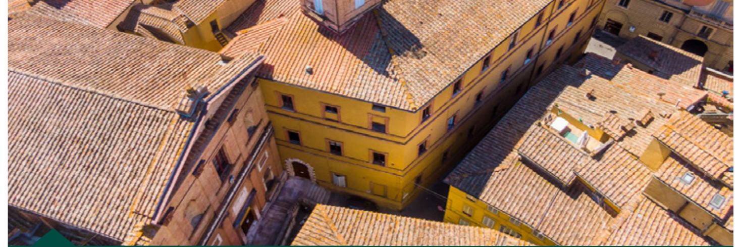
Università degli Studi - Siena