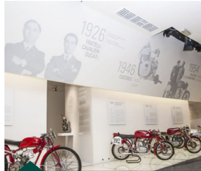
Ducati Motor Holding S.p.A. - Bologna