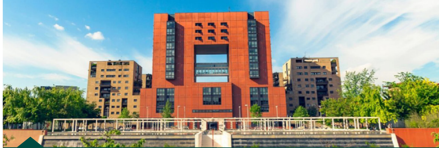
Università Bicocca - Milano