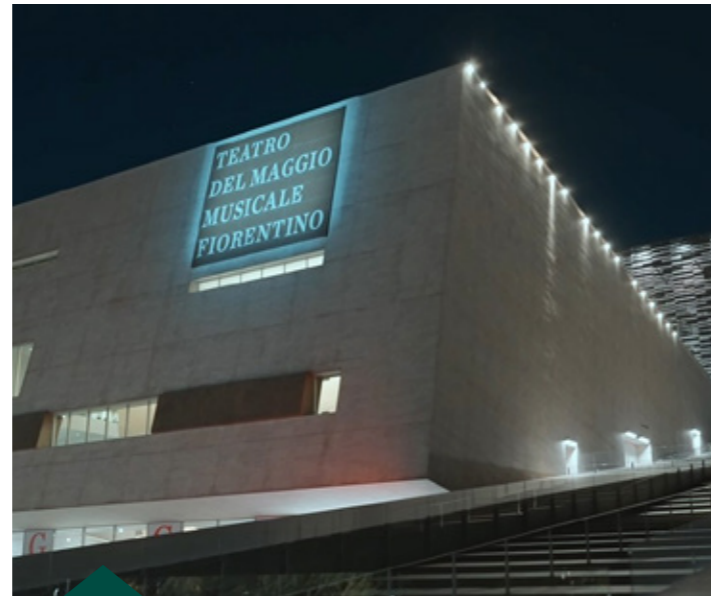
Teatro del Maggio Musicale Fiorentino