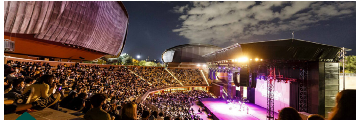
Auditorium Parco della Musica - Roma