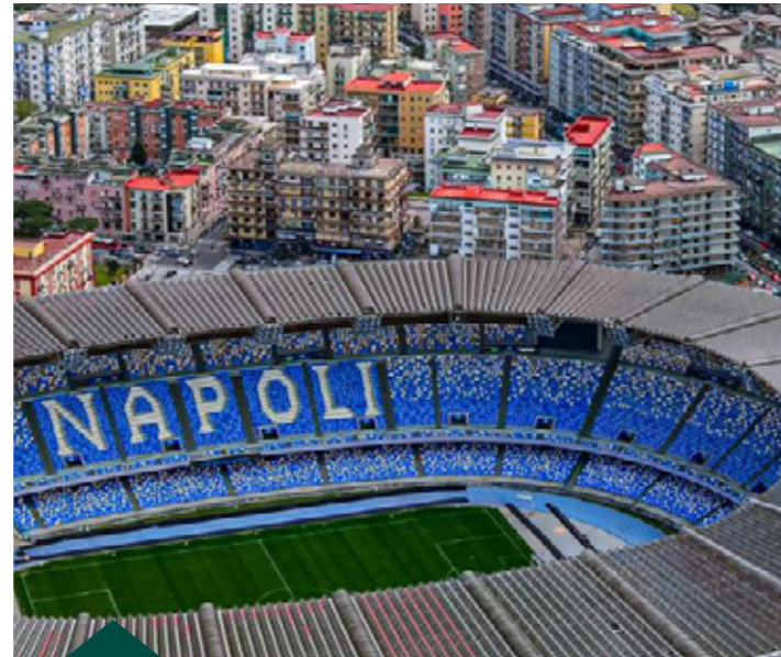
Stadio Diego Armando Maradona - Napoli