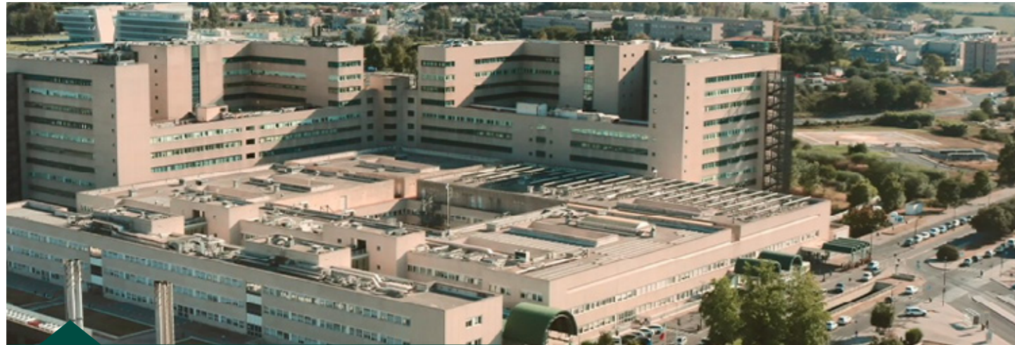
Policlinico Tor Vergata - Roma