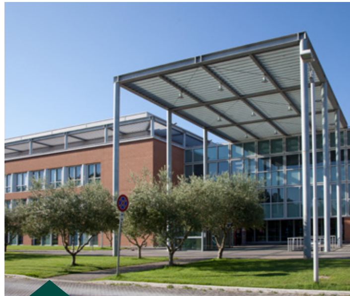
Campus Biomedico - Roma