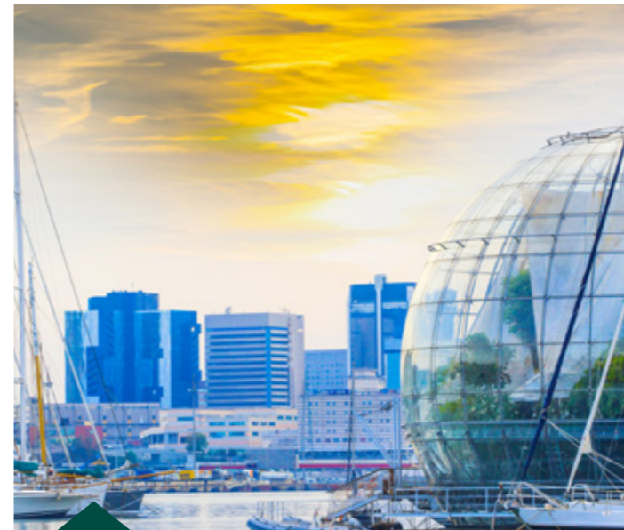
Acquario di Genova