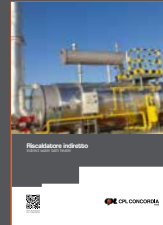
Indirect water bath heater