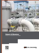
Filtration and separation technologies