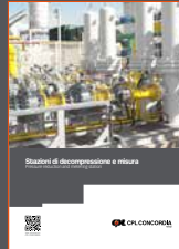
Pressure reduction and metering station