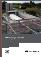
LNG Technologies & Solutions