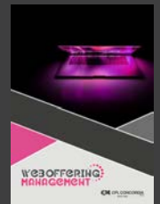
Web Offering Management