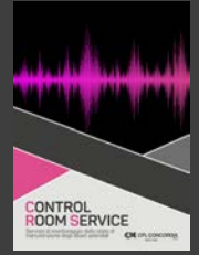
Control Room Service