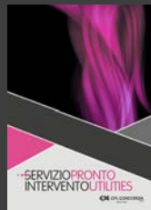
Servizio di Pronto Intervento per le Utilities