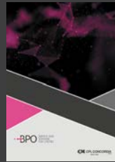
BPO - Business Process Outsourcing